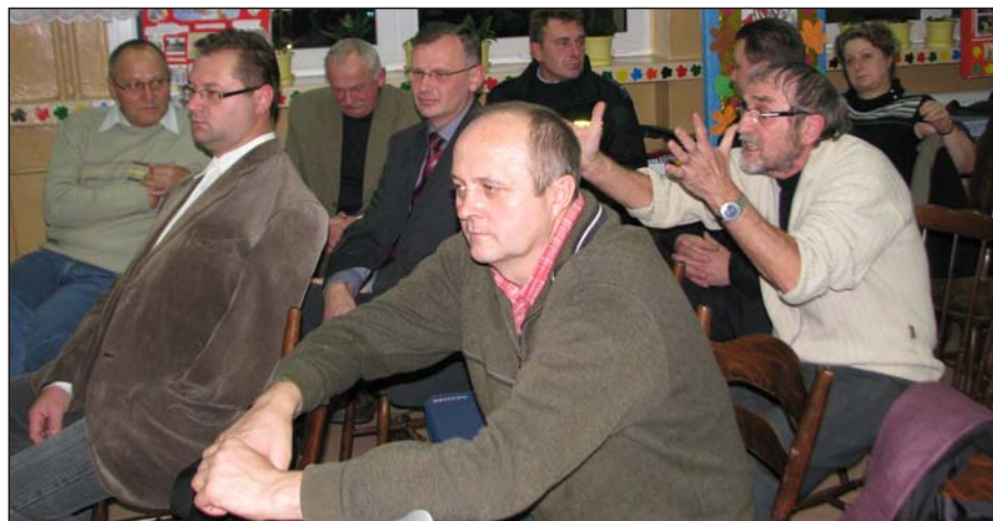
Zebrań w Szkole Podstawowej nr 1.