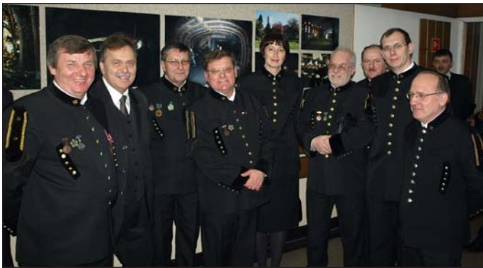
Grupa pracowników Wydziału Przeróbki.

► podczas wcześniejszych spotkań. „Medale za długoletnią służbę” otrzymały 74 osoby, Odznaki Honorowe „Zasłużony dla górnictwa RP” - 31, Odznaki „Zasłużony Pracownik Kopalni Ziemowit” - 80.