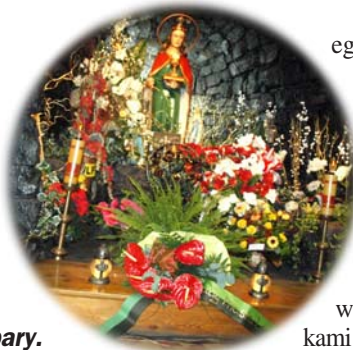
Kwiaty od Rady Miasta przed figurą św. Barbary.