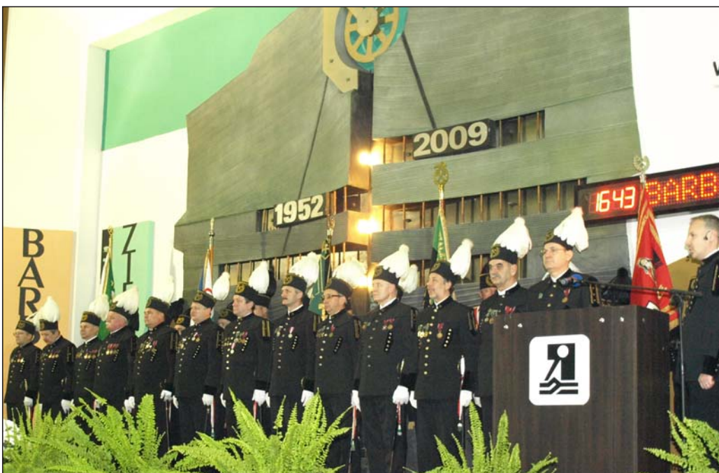
Stara Strzecha za chwilę będzie przekazywać honorowe szpady górnicze.