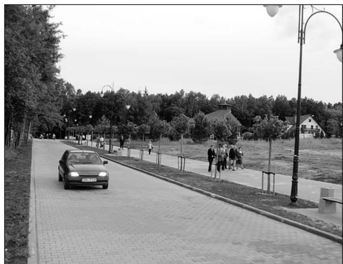
Aleja Matki Bożej Różańcowej.