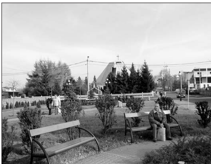
Skwer na rogu Hołodunowskiej i Rubega.