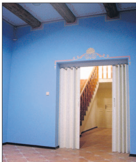
Sala obsługi czytelników.