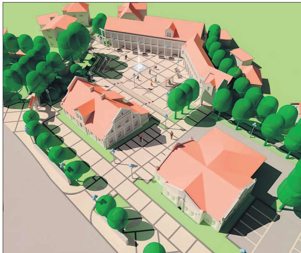
Wizualizacja projektu „Rewitalizacja historycznego Centrum Łęzin – Plac Farski”.