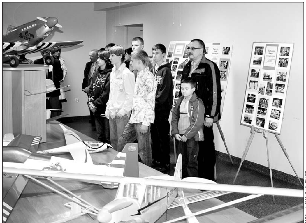
Na wystawie prezentowane są różne modele, dokumenty i zdjęcia.

Kiedy w trakcie stanu wojennego przywrócono działalność Domu Kultury „Piaś”, Arka-