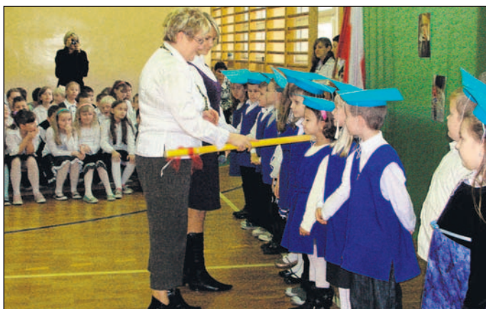
Pasowanie uczniów SP nr 4 w Goławcu.

► 21 października, tradycyjnie w przeddzień Święta Patrona Szkoły, pierwszoklasiści SP z OI nr 1 im. Karola Miarki ślubowali być dobrymi uczniami, dbać o honor szkoły, dobrze się uczyć, służyć pomocą słabszym, słuchać nauczycieli i innych przełożonych, sprawiać radość swoim rodzicom i wychowawcom, ażeby wyrosnąć