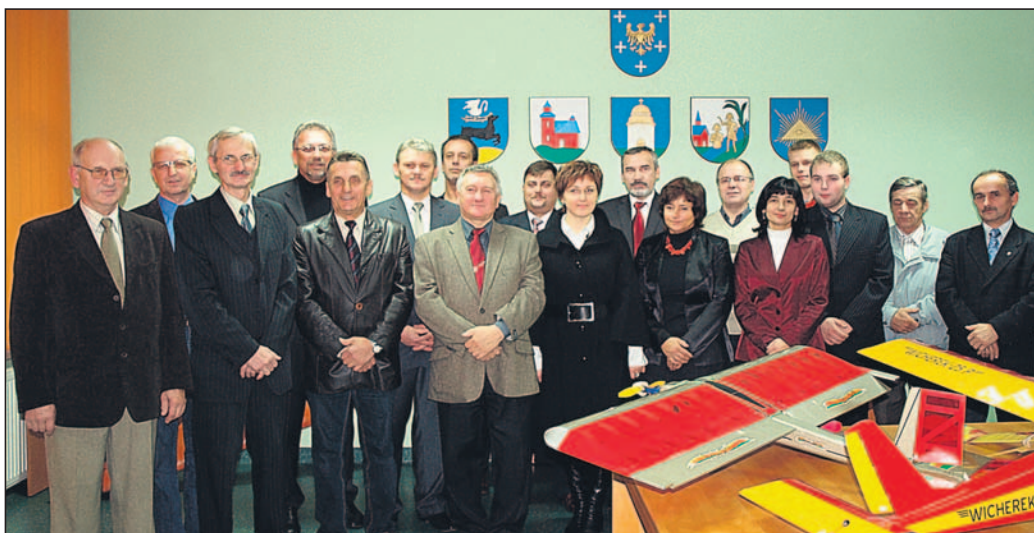
Pamiątkowe zdjęcie (części) uczestników jubileuszowego spotkania.

► Pod patronatem Ligi Obrony Kraju 27 października w Łędzinach odbyły się uroczyste obchody 10-lecia modelarstwa w Powiecie Bieruńsko-Łędzińskim pod patronatem Ligi Obrony Kraju oraz 40-lecia modelarstwa w Łędzinach. Spotkanie zasłużonych modelarzy i działaczy LOK w Powiatowym Centrum Społeczno-Gospodarczym połączone zostało z otwarciem okolicznościowej wystawy prezentującej działalność i dorobek modelarzy i poszczególnych kół LOK oraz prezentacją okolicznościowego wy-