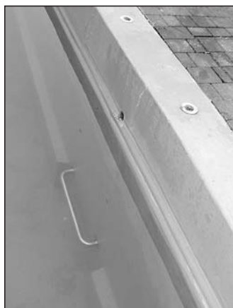
Tyle zostało po wyrwanej drabince do basenu.

► Pisaliśmy o generalnym remoncie basenu odkrytego w ośrodku Zalew. Po remoncie wygląda jak nowy. Cieszy oczy, przyjemniej się w nim pływa lub pluska. Nie wszyscy tom jednak potrafią uszanować. W połowie lipca wandale wyrwali jedną z metalowych poręcz dla schodzących i wychodzących z wody. Na szczęście ktoś ją odnalazł i została znów zamontowana.