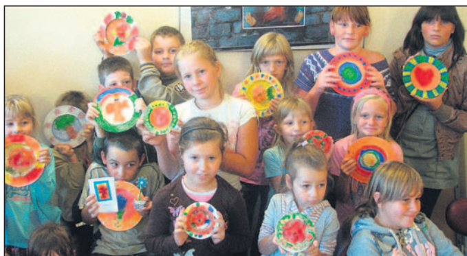
Po zajęciach rękodzielniczych w MOK.

Miejski Klub Sportowy zorganizował kilkanaście spotkań z dziećmi na stadionie i wokół niego w formie treningów ogólnorozwojowych bądź trenin-