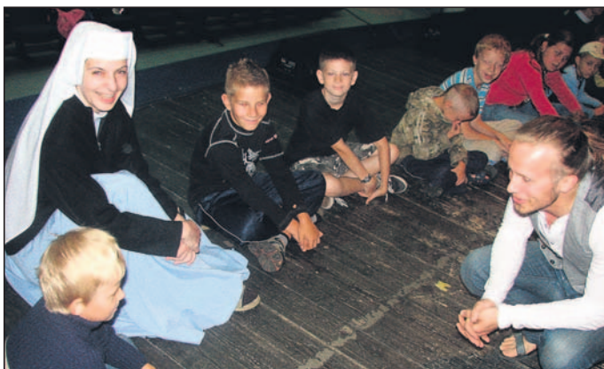
Warsztaty teatralne z MOK.

cznego, na których zakończone były wycieczki, spektakl teatru lalek itp.