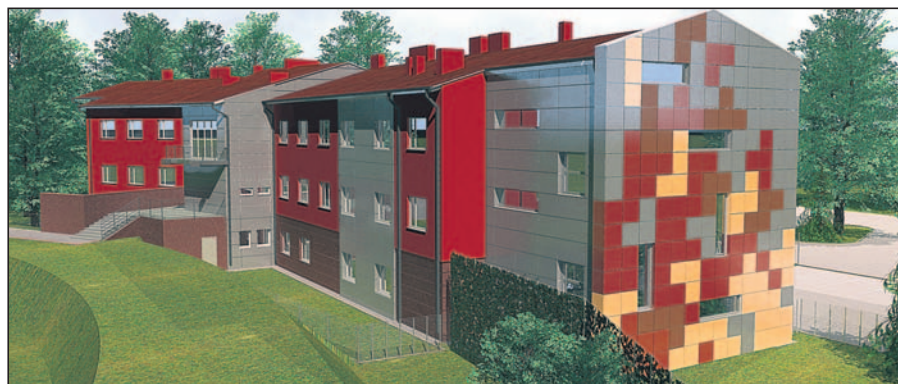
Tak będzie wyglądać budynek MKS i przedszkola.