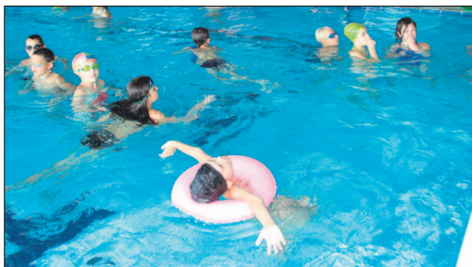
Dla ochłody - kąpiel w basenie.