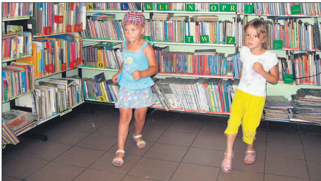
Popisy taneczne najmłodszych w bibliotece.

Miejski Ośrodek Kultury zaoferował dzieciom bogaty program zajęć w swojej siedzibie przy ul. Hołdunowskiej, w sali „Piast” i na krytej pływalni, ponadto sporo ciekawych wycieczek poza Łędziny (w tym do Suchoj Beskidzkiej i na plener malarski do Cieszyna). W tym roku MOK harmonogram zajęć wakacyjnych opracował w formie tygodni tematycznych: plastycznego, tanecznego, teatralnego, rękodzielniczego, fotograficznego, garncarskiego, wokalnoinstrumentalnego i ludowo-etnograficznego,