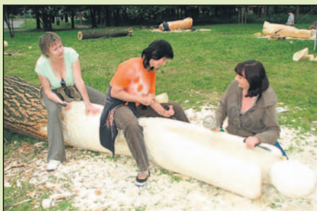
Rzeźbiarki z Revucy.

Pracy artystów przyglądali się przedstawiciele łędzińskich władz oraz wielu mieszkańców.