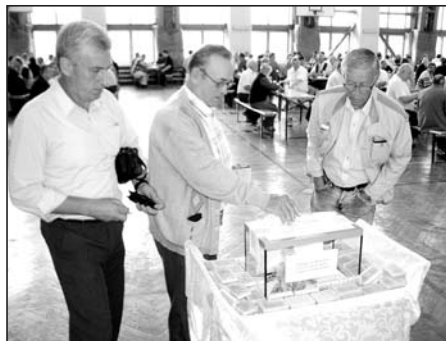
Dobrowolne datki dla powodzian.

Po raz ósmy w ogóle, ale po raz pierwszy latem, 4 lipca kwestowała w Łędzinach Wielka Orkiestra Świątecznej Pomocy. Celem było