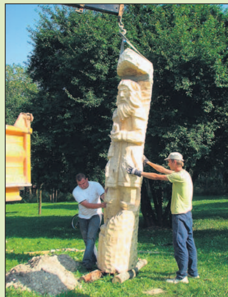
Montaż dzieł na placu przy ratuszu.