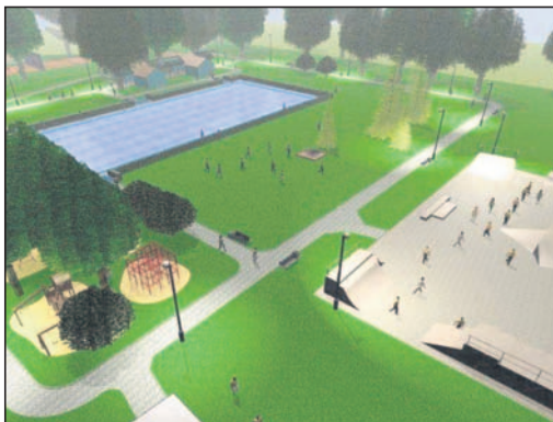
Widok od strony istniejącego parkingu przy ul. Stadionowej.

Wykonana została dokumentacja projektowa budowy i modernizacji obiektów rekreacji sportowej na „Zalewie” (przedstawionych na wizualizacji) a przewidzianych do realizacji w latach 2011-2012. W ramach tego zadania zostanie wykonany: skate park, boisko do piłki plażowej z trybunami, nowe boisko i ściana do ćwiczeń w tenisa oraz plac zabaw. Całość zostanie skomunikowana alejkami spacerowymi, a teren zostanie oświetlony. /KB/