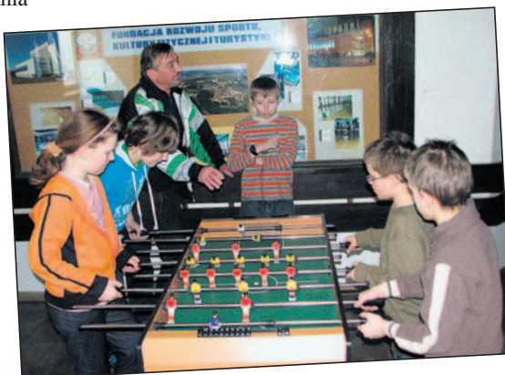
Zajęcia w „Centrum”...