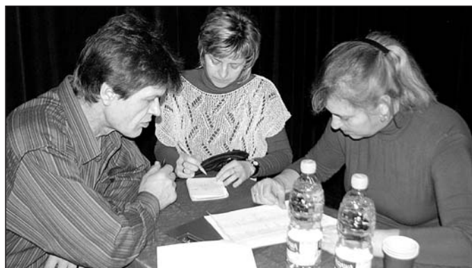
Komisja skrutacyjna przy pracy.

Członkowie zarządu wręczyli osobom szczególnie zaangażo-