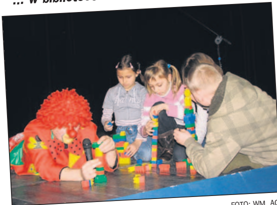
... w MOK.