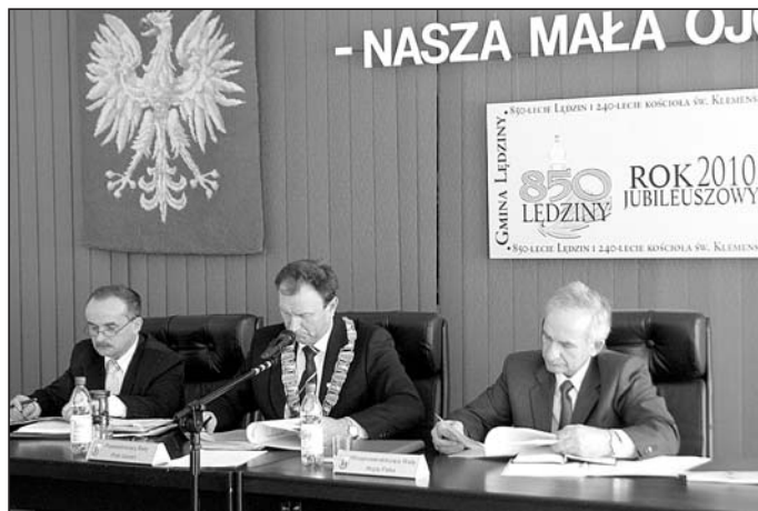
Rada Miasta w tej kadencji poświęciła tematowi wody kilkanaście posiedzeń.

1. Ksero protokołu ze spotkania zespołu ds. analizy i weryfikacji