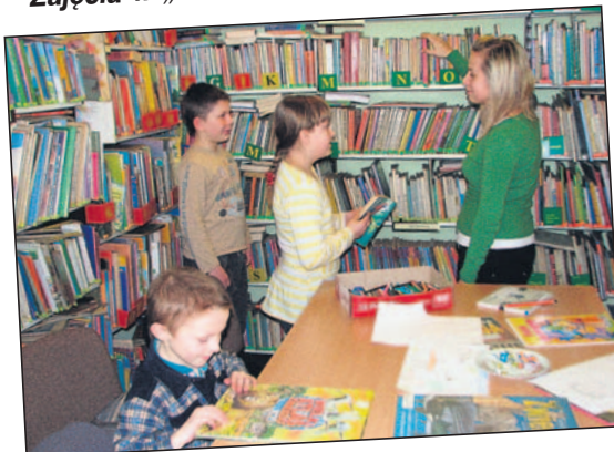
... w bibliotece...