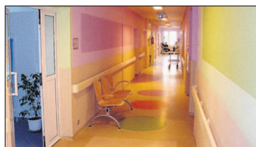
Po remoncie przychodnia prezentuje się okazale z zewnątrz i od środka.

W kolejnym etapie MZOZ pozyskał dotację ze środków unijnych w wysokości ok. 1 mln zł na remont Przychodni Specjalistycznej. Nowy wygląd zyskała elewacja budynku, wyremontowano korytarze i klatki schodowe. Cały został przystosowany do nowych przepisów przeciwpożarowych. Przepro-