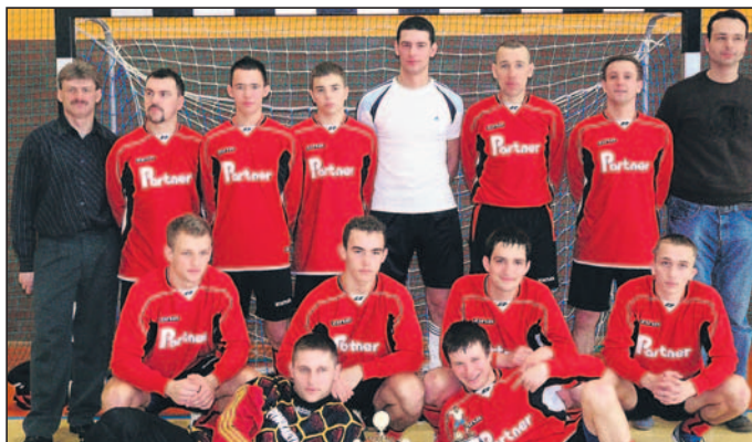
Drużyna MKS Łędziny.

► W rozegranych 30 stycznia zawodach w finale turnieju ponownie spotkały się drużyny gospodarzy i MKS Łędziny. Zanim jednak do tego doszło, łędzinianie przeszli wyboistą drogę do finału w rozgrywkach grupowych. W pierwszym spotkaniu z Pogonią Imielin, mimo optycznej przewagi, jaką posiadali przez cały mecz i objęciu prowadzenia, musieli gonić wynik. Na zegarze pozostawało kilkanaście sekund do końca spotkania, gdy Karlik po raz drugi w tym meczu trafił do siatki i ustalił wynik