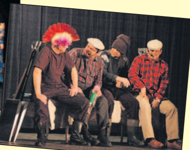
Afera aferą, mamrota czas wypić... ▶