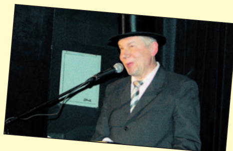
Reżyser jest zadowolony.