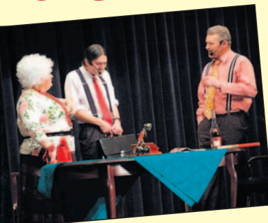
Afera wybuchła. Wójt (I), wójtowa i sekretarz zastanawiają się, co robić.