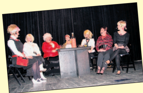
Kobiety biorą sprawę w swoje ręce.