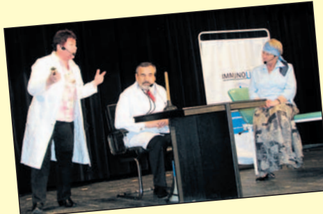
W gabinecie Wezółta.