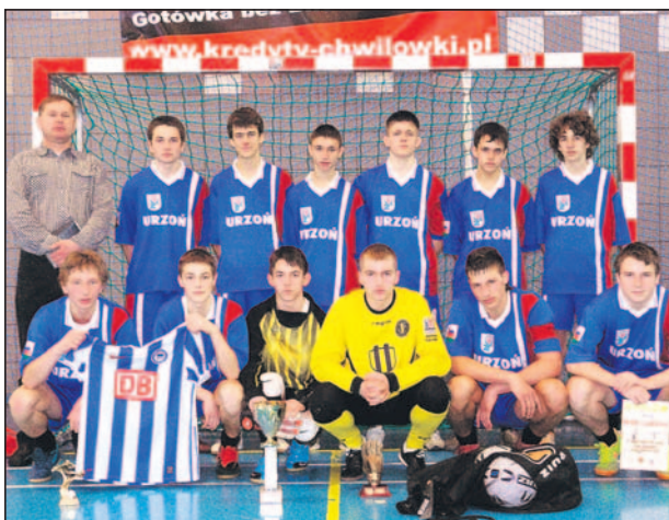
Juniorzy MKS, zwycięzcy bieruńskiego turnieju.

MKS pewnie awansował do półfinału zwyciężając we wszystkich spotkaniach grupowych, pokonując kolejno: LKS Radziechowy 6:1, Pogoń Imielin 2:1 i Podlesiankę Katowice 5:1. W półfinale młodsi łędzinianie po trudnym spotkaniu pokonali MOSM Tychy 2:1, a gole zdobyli Janik i Ingram. W finale MKS zmierzył się z gospodarzami – bieruńską Unią. Nasi zawodnicy dobrze rozpoczęli mecz i po dwóch golach Rafała Papacza prowadzili 2:0. Rywale doprowadzili do wyrównania,