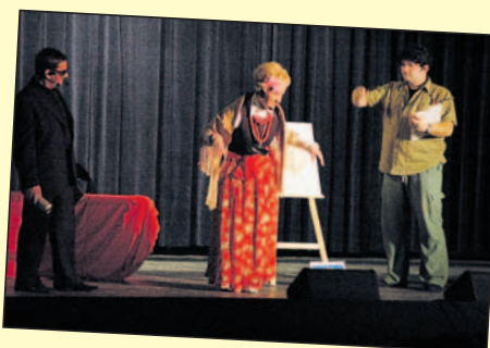
Lodzia zamawia portret.