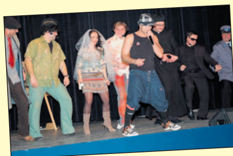
"Tito" trudno dorównać.