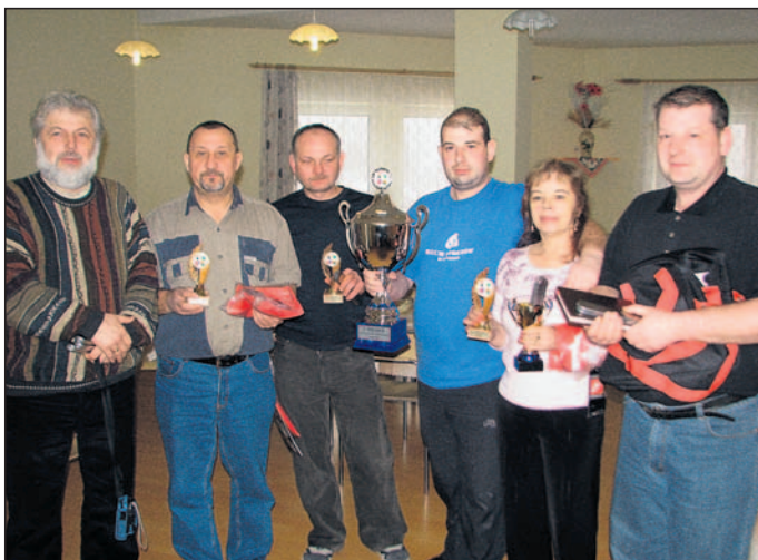
Nagrodzeni zawodnicy i goście turnieju w Wiśle.

Wyjazd miał charakter integracyjny, bo odbył się z udziałem osób towarzyszących. /WM/