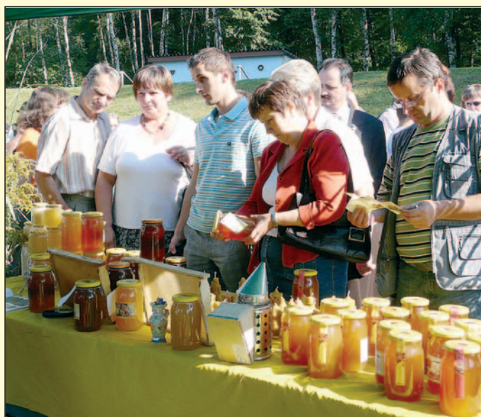
Stoisko hodowców pszczół.