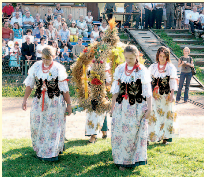
Wniesienie korony dożynkowej.