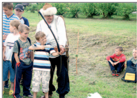
Strzał był w "10".

Program imprezy był zaskakująco bogaty. 50 dzieci uczestniczyło w plenerze malarskim "Wesoły znaczek pocztowy". W nagrodę za swoje prace otrzymały nagrody ufundowane przez Poczta Polską. Organizatorem i głównym jurorem pleneru była