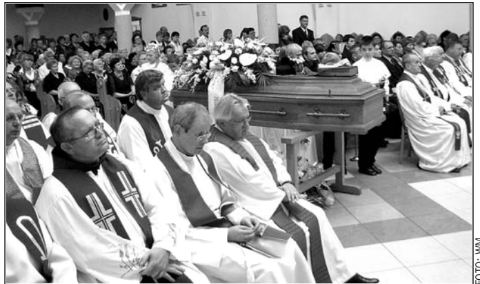
Znanego księdza pożegnało kilkudziesięciu kapłanów

Potrąfił z uśmiechem stworzyć taką atmosferę w grupie roboczej, że ludzie z ochotą włączali się do roboty. Tym bardziej, że często służył przykładem. Ramię w ramię z nami pracował na budowie.