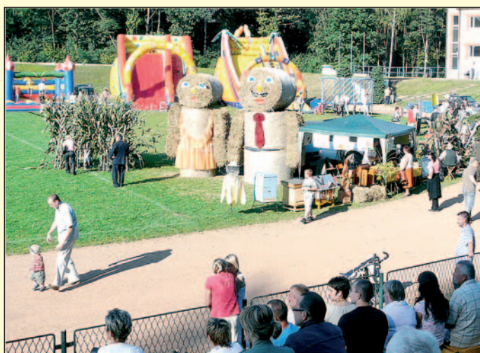
Wystawy dożynkowe na stadionie MKS.