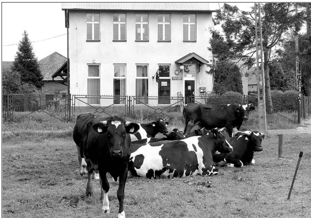
Pastwisko obok poczty przy ul. Szenwalda.

Na terenie miasta znajduje się ponad 1000 działek i gospodarstw rolnych. Najwięcej - 778 - o obszarze do 1 ha. 28 ma obszar 3-5 ha, 94 gospodarstwa - powyżej 5 ha. W gospodarstwach największy areał upraw obejmują zboża (ponad 50%), 15 % ziemniaki, 8,5 % z uprawy przemysłowe (buraki cukrowe, rzepak). Według aktualnych danych łędzinscy gospodarze mają w oborach i chlewach 921 krów (72 gospodar-