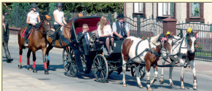
W dożynkowym korowodzie.