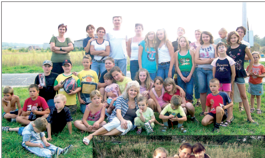
Uczestnicy podsumowania konkursu.