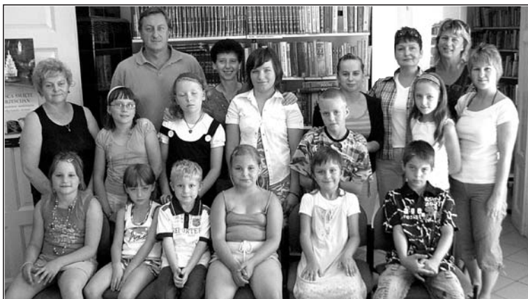
Organizatorzy i uczestnicy konkursu recytatorskiego w MBP.