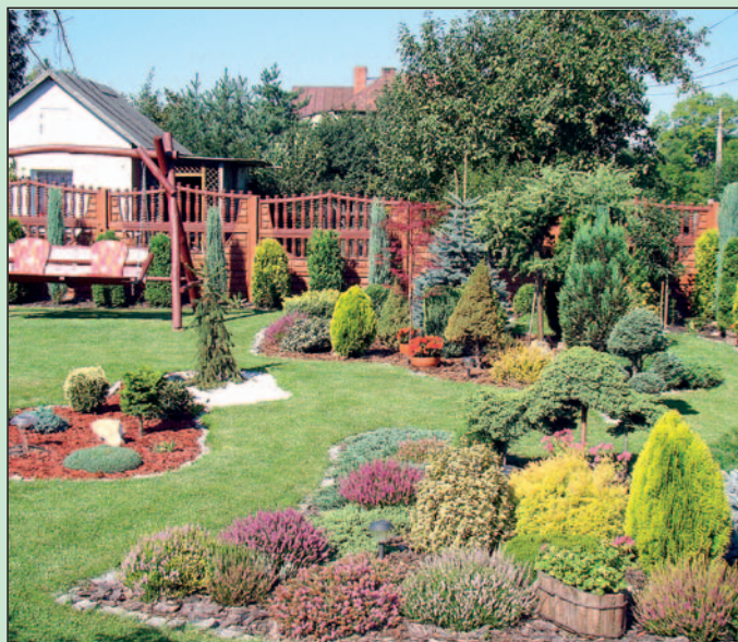
To miejsce wyczarowała Otylia Węgrzynek (III miejsce).