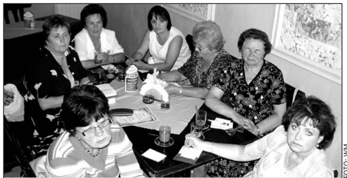
Grupa uczestniczek zebrania.

► Zarząd Lędzińskiego Stowarzyszenia Na Rzecz Osób Niepełnosprawnych i Ich Rodzin na zebraniu 2 września zapowiedział wystąpienie do władz miasta o utworzenie publicznego domu opieki dla osób niepełnosprawnych wymagających opieki całodobowej. Uzasadnieniem jest pilna potrzeba takiej placówki.