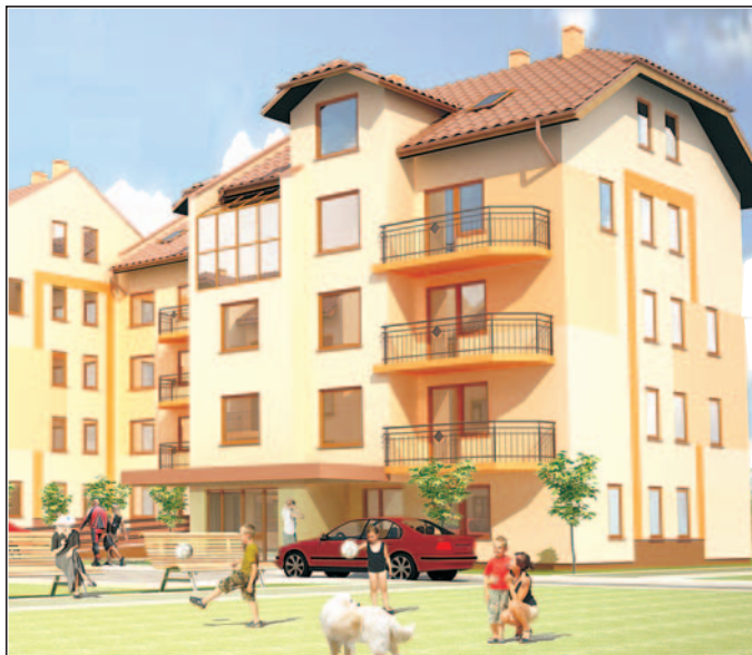
Tak mają wyglądać budynki przy ul. Długosza.

▶ Uważni przechodnie mogą zauważyć przy ul. Łędzińskiej dużą reklamę sprzedaży mieszkań w kompleksie mieszkaniowym przy ul. Długosza. Chodzi dawne tak zwane "stany zerowe", które miasto sprzedało prywatnemu inwestorowi z Mysłowic, występującemu pod marką Dostępny Dom. Jak poinformowała Iłona Wiśniewska, specjalista ds. sprzedaży, powstanie tam 17 budynków wielorodzinnych, a w nich 264 mieszkania jedno-, dwu-, trzy-, cztero- i pięciopokojowe, o powierzchni od 29 do 107 m 2 . Mieszkania będą przekazywane przyszłym użytkownikom w stanie deweloperskim.