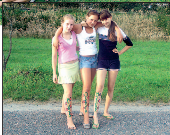
Efekt zdobniczej działalności uczestniczek zabaw.

Teren, na którym spotykały się mieszkańcy, należycie przygotowała firma Ekorec, ale brakuje w tym miejscu placu zabaw i ławek, na których mogłyby usiąść osoby opiekujące się dziećmi. /gt/