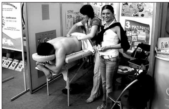
Można było skorzystać z masażu.

► Na 80 tak zwanych podmiotów wystawiających się na niedawnych VI Powiatowych Targach Przedsiębiorczości i Ekologii w Imielinie "naszych" było 13. Lędziny reprezentowało między innymi stoisko Urzędu Miasta, z wieloma gadżetami, wydawnictwami i informatorami o mieście. Należało do najciekawszych i najbardziej atrakcyjnych, budziło zainteresowanie targowych gości.