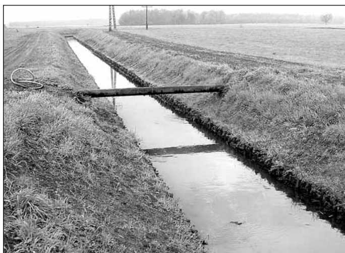
... i po regulacji.