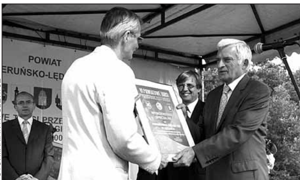
Dyplom dla PZ LOK.

prezentacja też była skromniejsza niż w latach ubiegłych, podobnie jak liczba odwiedzających targi, uczestników towarzyszących im konferencji, a nawet imprez artystycznych. Potencjalni adresaci słabo zainteresowali się imprezą albo wy-