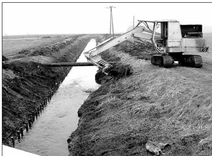
... w trakcie