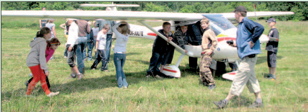
Samolot ultralekki wzbudzał nieustanne zainteresowanie nie tylko dzieci i młodzieży.