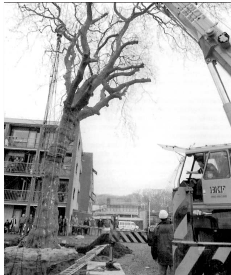
Przesadzanie 100-letniego drzewa

z jak największą ilością jego systemu korzeniowego i ziemi. Dotychczas największa bryła pobrana