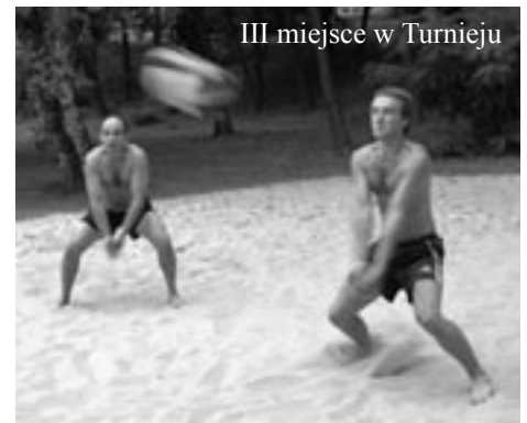
III miejsce w Turnieju