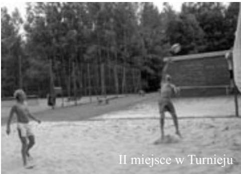
II miejsce w Turnieju

„Nie ma to jak rodzina” - o wartości rodzinnych więzów przekonali się również uczestnicy tegorocznego I Powiatowego Turnieju Siatkówki Piłkowej. Dwie spośród finałowych drużyn