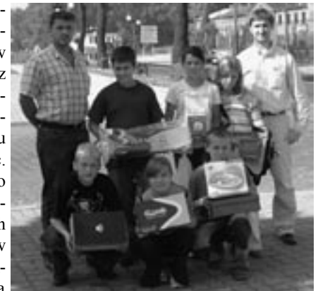
Zwycięzcy Turnieju Pływackiego wraz z organizatorami - członkami Stowarzyszenia Na Rzecz Rozwoju Sportu

Nie najlepsza pogoda w sierpniu spowodowała trudności w przeprowadzeniu imprez sportowych zaplanowanych przez Stowarzyszenie Na Rzecz Rozwoju Sportu na ten miesiąc. Słońce nie zapomniało jednak całkowicie o tegorocznych wakacjach i zaświeciło jeszcze w ostatni wakacyjny weekend. Nagła poprawa pogody pozwoliła na natychmiastowe zrealizowanie przynajmniej