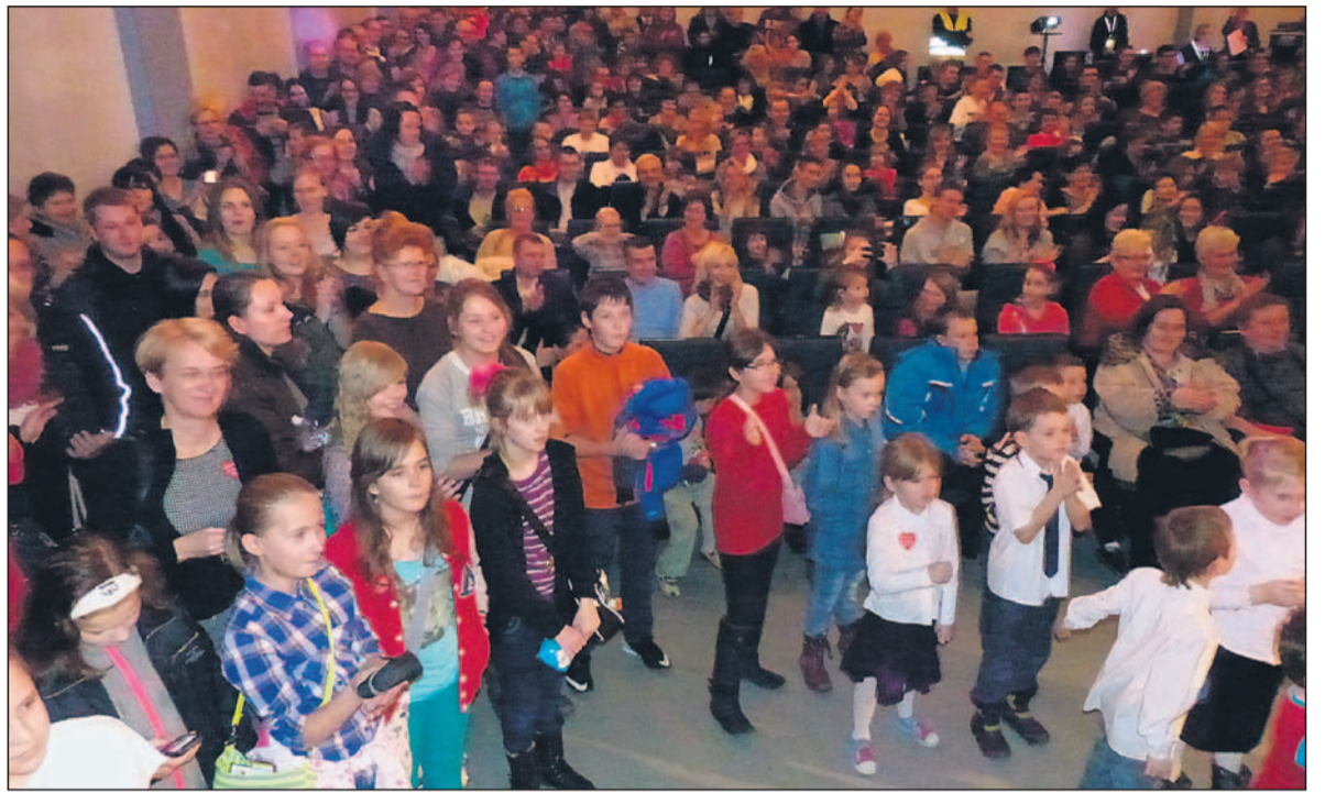
Sala Piast wypełniona po brzegi.