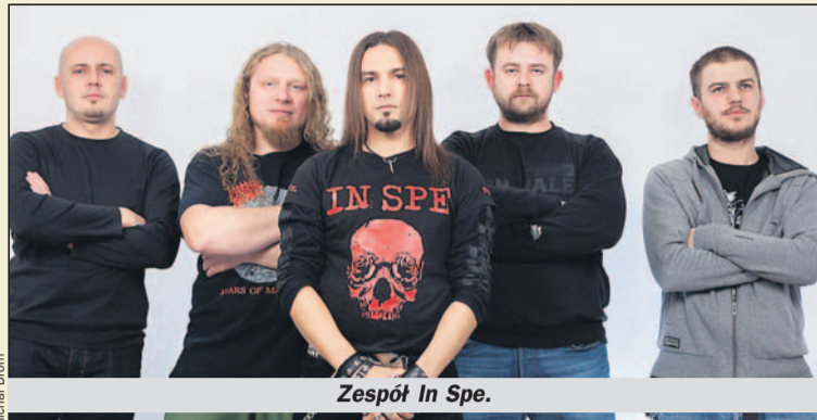
Zespół In Spe.