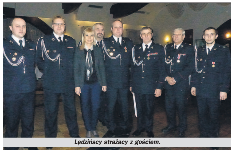
Łędzinscy strażacy z gościem.