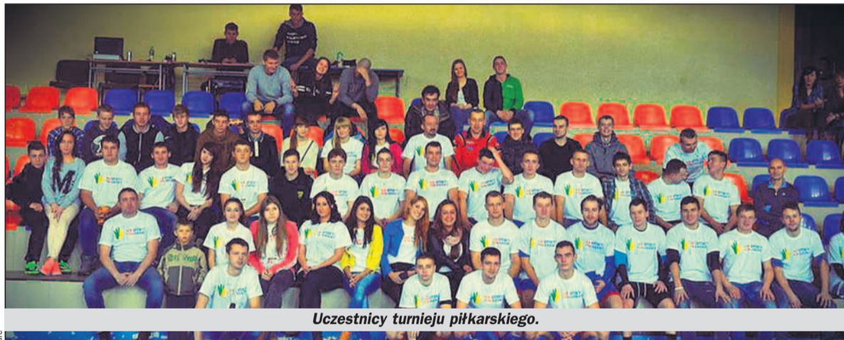
Uczestnicy turnieju piłkarskiego.

W trakcie koncertu przeprowadzono licytację różnych przedmiotów, począwszy od wspomnianego pucharu, poprzez koszulki i piłki z podpisami zawodników drużyn MKS Łędziny oraz JUWe Jarosławice, tortu, a skończywszy na markowym telewizorze. Podczas tak zwanych „bitw o pomoc” ich uczestnicy prześcigali się w wysokości datków wrzucanych do puszeki.