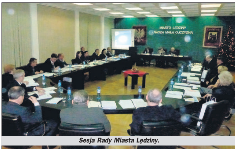
Sesja Rady Miasta Lędziny.

Różnica między dochodami miasta a wydatkami wyniesie 3 646 000,00 zł, i zostanie pokryta przychodami pocho-