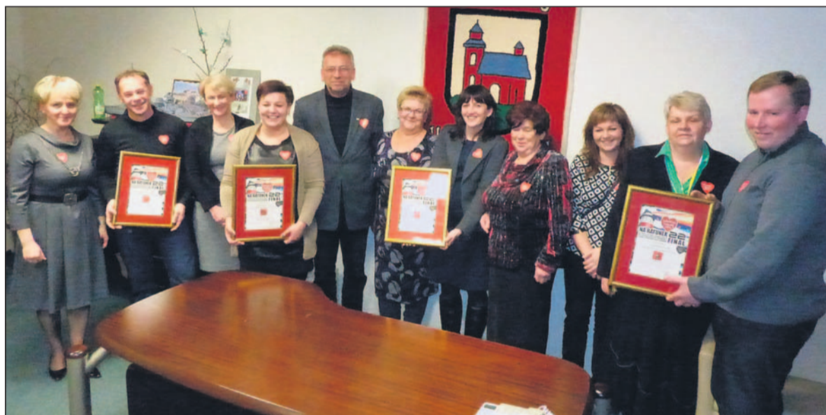
Ofiarodawcy i nabywcy złotych serduszek.