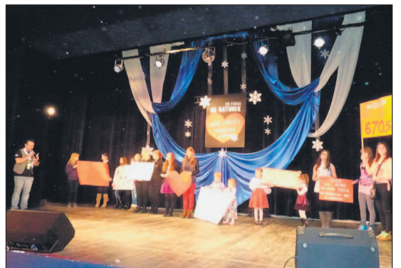
Czeki od przedszkoli i szkół.