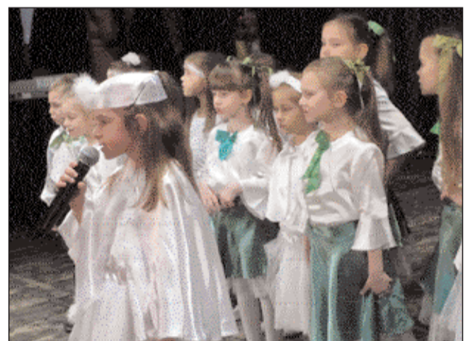
Zespół Koniczynki z Przedszkola nr 2.