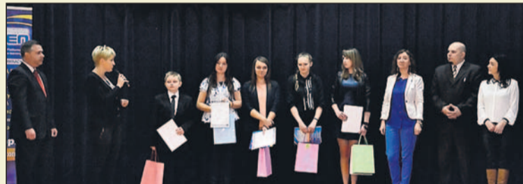
Finaliści na scenie.