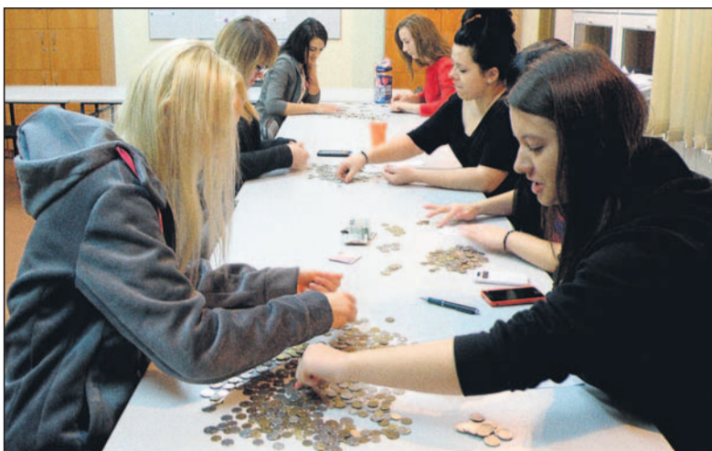
Wolontariusze w PZS liczą pieniądze.