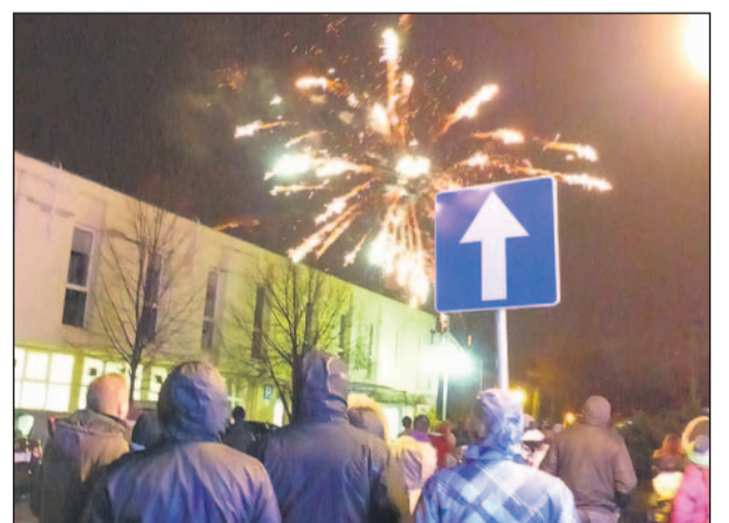
Obowiązkowy kierunek do nieba.