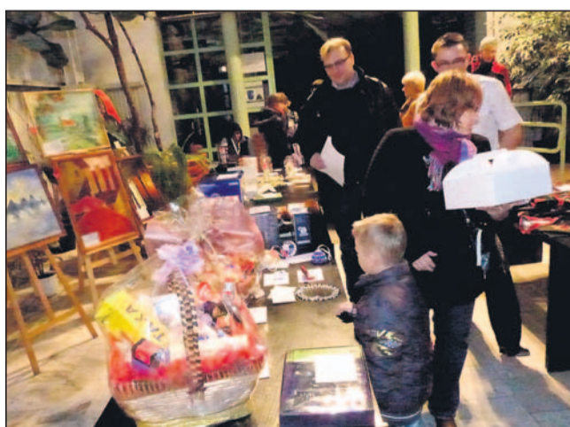
Było w czym wybierać.