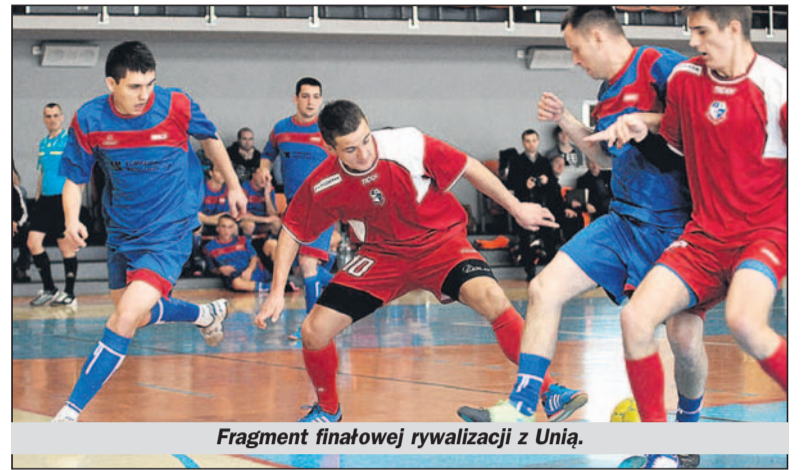
Fragment finałowej rywalizacji z Unią.