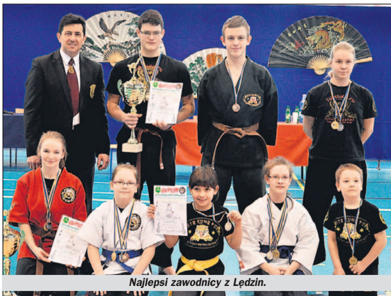
Najlepsi zawodnicy z Łędzin.

Organizatorem zawodów był Ośrodek Szkolenia Sztuk Walki Big Kung-Fu.