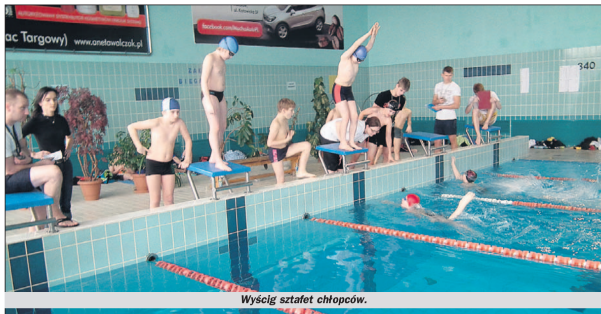
Wyścig sztafet chłopców.