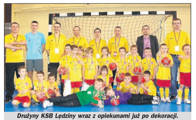
Drużyny KSB Łędziny wraz z opiekunami już po dekoracji.