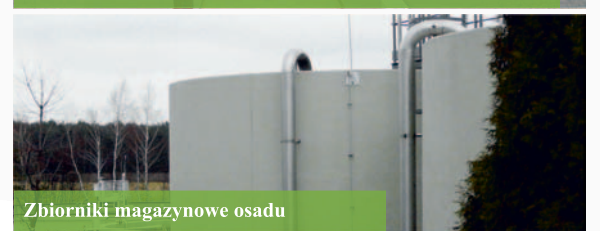
Zbiorniki magazynowe osadu

- Przy modernizacji i rozbudowie oczyszczalni ścieków „Ziemowit” stosowane są nowoczesne technologie i materiały, co sprawia, że obiekt spełniać będzie najwyższe standardy na poziomie technicznym i eksploatacyjnym, a co najważniejsze zgodne z obowiązującymi normami i przepisami krajowymi i Unii Europejskiej - podkreślają pracownicy Jednostki Realizującej Projekt.