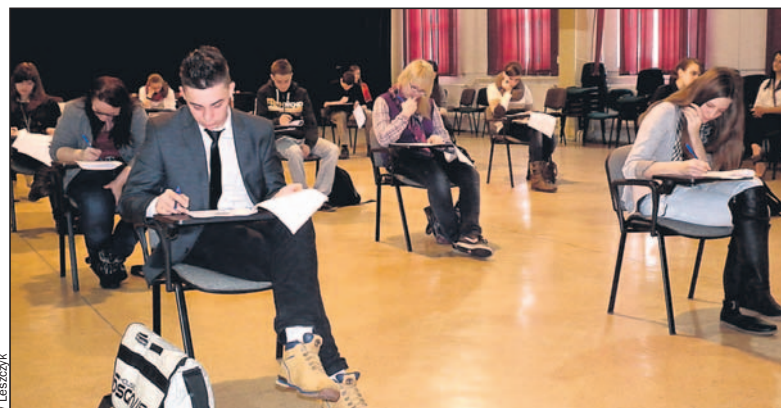
Testy wymagają skupienia.

Nagrody dla laureatów oraz upominki dla wszystkich uczestników konkursu ufundowane zostały przez Starostwo Powiatowe, Radę Rodziców przy łędzińskim PZS i firmę Marko z Łędzin. Słodki poczęstunek dla uczniów i ich opiekunów ufundowała łędzińska firma Krzemień. m