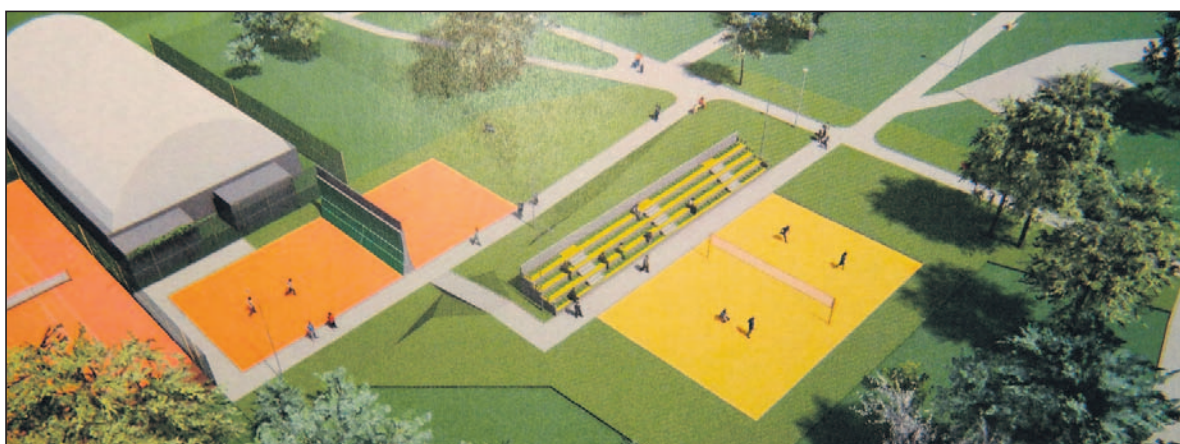
Wizualizacja projektowanej ściany do tenisa z boiskiem do piłki plażowej.

– Korty lędzińskie dzięki położeniu w zaciszu drzew chroniących przed wiatrem i słońcem oraz przygotowaniu naturalnej nawierzchni zawsze cieszyły się bardzo dobrą opinią wśród użytkowników, goszcząc graczy nie tylko z miasta czy powiatu ale również z całego województwa, dlatego też warto tę ofertę rozwijać – dodaje burmistrz.