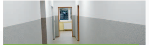
O. Ziemowit wewnątrz budynku administracyjno-socjalnego

- Zaawansowanie prac przy budowie i modernizacji oczyszczalni ścieków szacujemy na ok 85 %. Najtrudniejsze roboty są już za nami. W najbliższych dniach i miesiącach wykonawca prowadzić będzie głównie prace wykończeniowe – informuje kierownik Jednostki Realizującej Projekt. Na obecną chwilę trwają prace zbrojeniowe i betoniarstwo na poszczególnych elementach bioreaktora. Równocześnie prowadzone są roboty drogowe – układanie krawężników i kostki brukowej na chodnikach oraz prace ziemne związane z docelowym ukształtowaniem terenu. Do końca stycznia w budynku administracyjno-socjalnym zamontowane zostanie wyposażenie laboratorium oraz meble w pomieszczeniach biurowych oraz w części socjalnej. Inwestycja opiewa na kwotę blisko 18 mln zł.