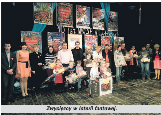
Zwycięcy w loterii fantowej.