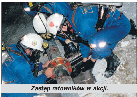
Zastęp ratowników w akcji.

W niedzielę, 13 stycznia, Wielka Orkiestra Świątecznej Pomocy zagrała u nas już po raz dziesiąty, czyli obchodziliśmy mały łędziński jubileusz. Jej sztab tradycyjnie powołano przy Powiatowym Zespole Szkół, a finałową imprezę współorganizował również Miejski Ośrodek Kultury. Tym razem była ona również okazją do promocji 60-lecia KWK „Ziemowit” oraz 50-lecia Centrum Badań i Dozoru Górnictwa Podziemnego w Łędzinach. W tym roku graliśmy na zakup sprzętu dla ratowania życia dzieci i zapewnienia godnej opieki medycznej seniorom.