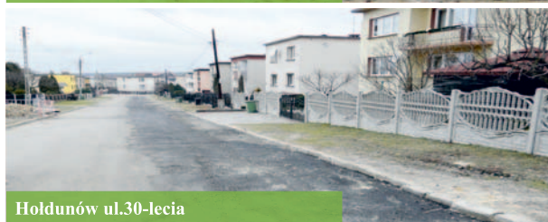
Hołdunów ul. 30-lecia

Prace budowlane prowadzone są w kilku miejscach jednocześnie. To wiąże się z wieloma uciążliwościami dla mieszkańców.