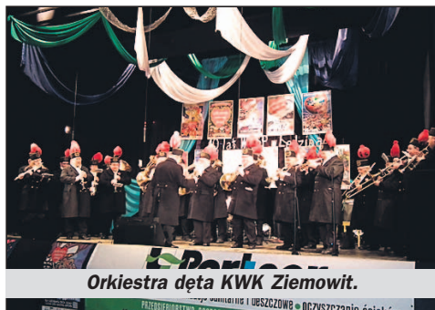
Orkiestra dęta KWK Ziemowit.

► Chyba z dobroczynnością Łędzinian nie jest tak źle, jak sądzą niektórzy z nas, skoro do dnia wydania gazety na koncie sztabu Orkiestry było już ponad 50 tys. zł. To rekordowa suma, która jeszcze może wzrosnąć. W ciągu 10 lat zebraliśmy ponad 380 tysięcy złotych. Nikt nie wie, z jakiej ilości aparatury zakupionej przez WOŚP skorzystali Łędzinianie, ale jedno urządzenie – inkubator – trafiło do Izby Porodowej a po jej likwidacji w porozumieniu z fundacją Owsiaka do Szpitala Wojewódzkiego w Tychach, gdzie najczęściej przychodzili na świat mali Łędzinianie.