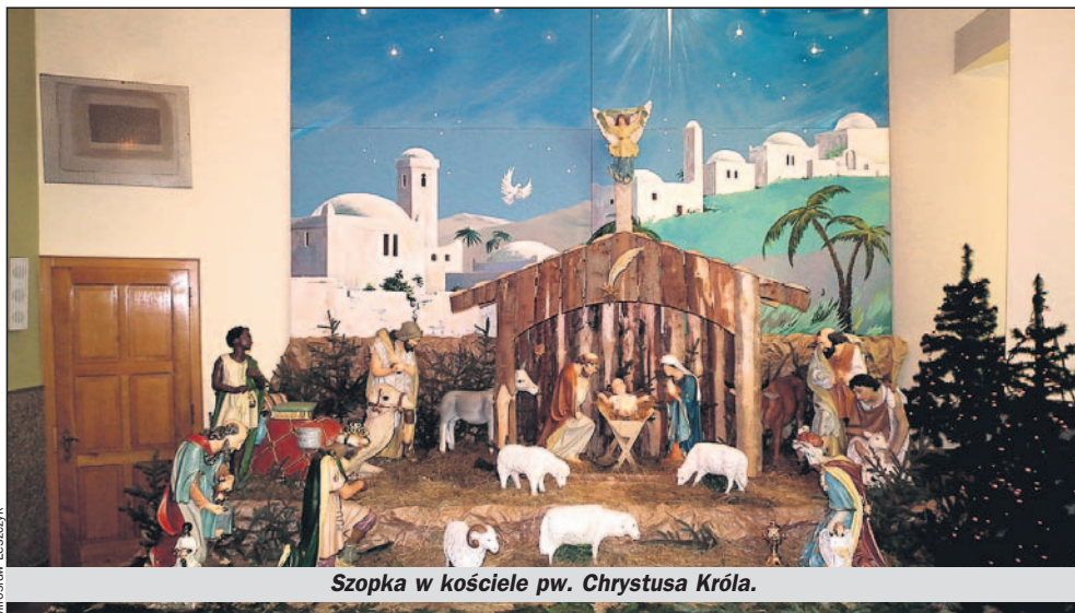
Szopka w kościele pw. Chrystusa Króla.

Cieszymy się, bowiem betlejska w hołdunowskim kościele pw. Chrystusa Króla zwyciężyła, i to zdecydowanie, w sondzie internetowej regionalnego tygodnika „Echo” na najpiękniejszą szopkę bożonarodzeniową w rejonie tyskim.