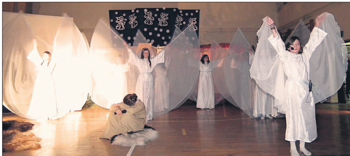
Nastrojowy taniec grupy Pneuma.

W czwartek, 20 grudnia, społeczność Gimnazjum z Oddziałami Integracyjnymi nr 2 im. Gustawa Morcinka obchodziła kolejne doroczne święto szkoły. Już od rana działy się ciekawe rzeczy. Między innymi na miejskim placu targowym grupa uczniów gimnazjum zaprezentowała taniec świąteczny (flesh mob), a wszystkich chętnych sprzedawców i kupujących częstowano upieczonymi w szkole świątecznymi ciasteczkami.