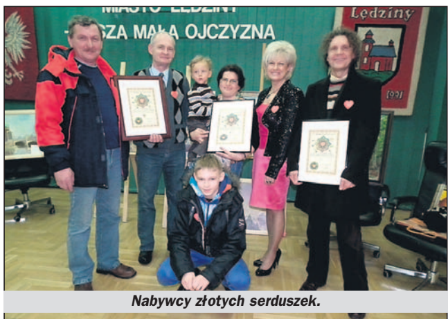
Nabywcy złotych serduszek.