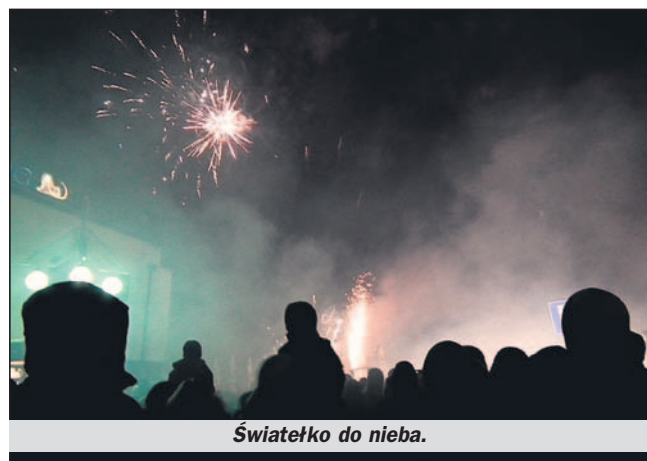
Świąteczka do nieba.