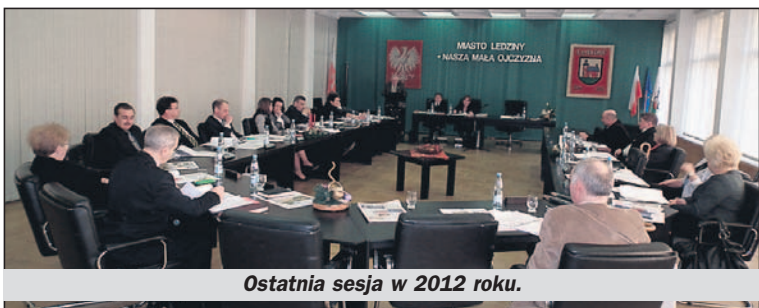
Ostatnia sesja w 2012 roku.

7 stycznia doszło do spotkania zespołu ds. podejmowania działań w zakresie weryfikacji wysokości ceny taryfy za 1 m3 wody przedstawionej przez RPWiK, składającego się z przedstawicieli Rady Miasta pracowników urzędu i przedstawicieli RPWiK, by wypracować wstępną propozycję odnośnie stawek za wodę na najbliższy rok. Jaka ona będzie, okaże się już niebawem, bo sprawa ta stanie na styczniowej sesji Rady Miasta, a wcześniej dyskutowana będzie na komisjach. Przedmiotem dyskusji w komisjach będą też kolejne regulacje w sprawie nowych zasad zagospodarowania odpadów komunalnych.