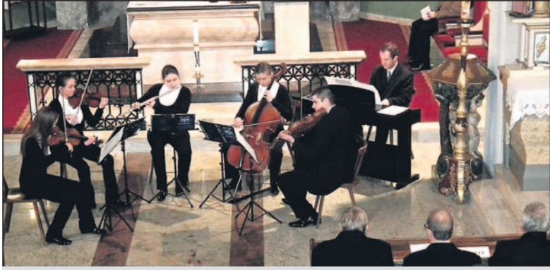
Gra zespół Ponticello.

Tematem kolejnego plenerowego wykładu, tym razem pod nazwą „Perła z Klemensowej Górki”, zorganizowanego przez Muzeum Śląskie w Katowicach w ramach trzeciej edycji cyklu „Śląsk na poziomie” (przybliżającego historię i sztukę Górnego Śląska), był zabytkowy XVIII-wieczny kościół św. Klemensa, obiekt bardzo ważny nie tylko dla dziejów naszej miejscowości, ale i dla całej bliższej oraz dalszej okolicy. Cieszy, że do projektu włączyło się Starostwo Bieruńsko-Łędzińskie, dzięki czemu po raz pierwszy w historii wspomnianego cyklu wykładowi towarzyszył koncert muzyczny.