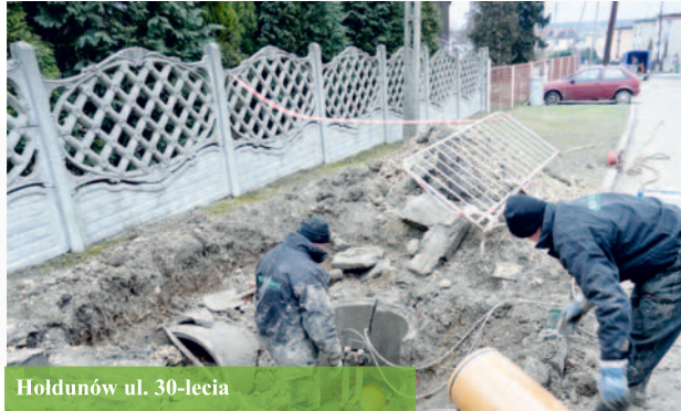
Hołdunów ul. 30-lecia

Najszybciej sieć powstaje w ramach kontraktu W2.4, którym objęta jest dzielnica Hołdunów. Wykonawca – firma „BUSKOPOL” S.A. do tej pory wybudował już ponad 9000 m sieci kanalizacji sanitarnej oraz deszczowej. Budowalcy skanalizowali już większość ulic z pierwszego i drugiego etapu. Na dniach natomiast rozpoczyna prace przewidziane w ramach trzeciego etapu, bowiem firma otrzymała już kolejne pozwolenia na budowę. Trzecim etapem objęte będą następujące ulice: Kilińskiego, Ruberga, Kordiana, Wandy, Storzyców, 25-lecia, Owocowa, Betonowa, Palmowa, część ul. Waryńskiego, Ekonomiczna, Lewandowskiej, Hołdunowska oraz Mickiewicza. W miejscach w których zachodzi konieczność wymiany istniejących przewodów kanalizacyjnych zastosowano bezwykopową metodę bursztynowania.