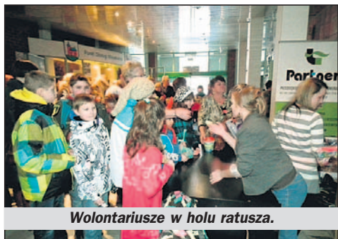
Wolontariusze w holu ratusza.