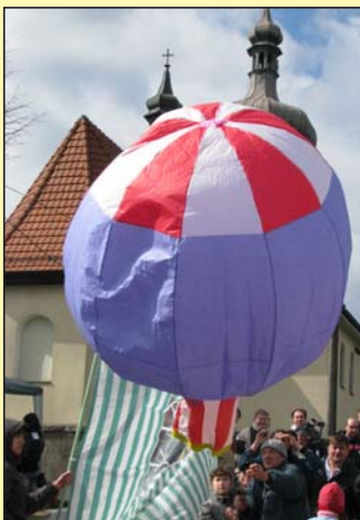
W barwach LOK.