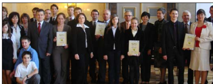
Na spotkaniu w Urzędzie Marszałkowskim.

i niepublicznych szkół podstawowych, gimnazjów i szkół średnich. Jego organizatorem jest organizuje Ministerstwo Gospo-