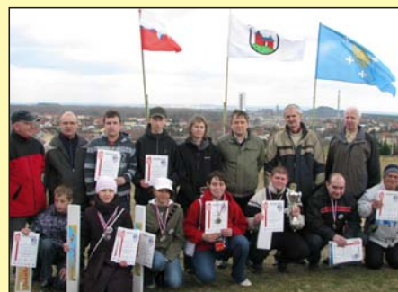
Najlepsi zawodnicy z gimnazjów i szkół podstawowych.