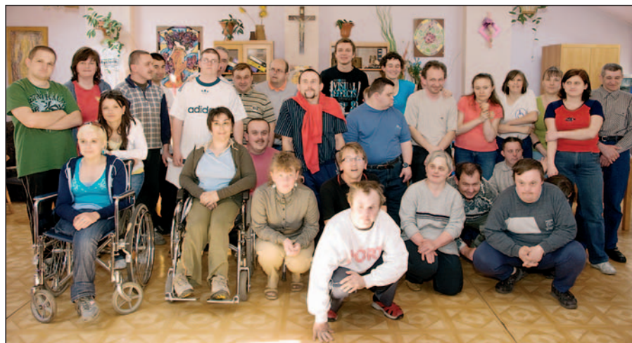
Wspólne zdjęcie z zespołem „Feel”.