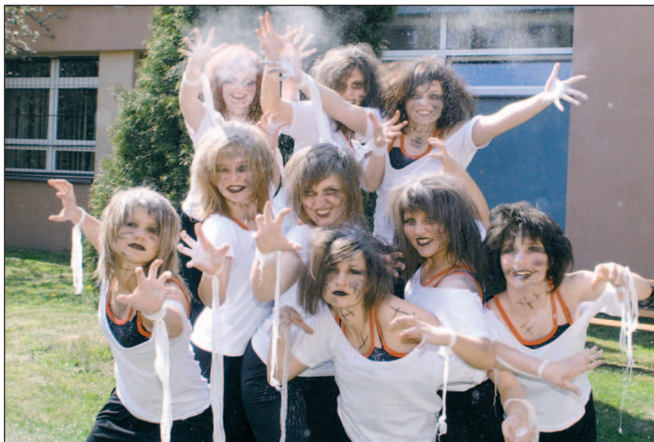
Grupa taneczna „Track” przed występem.

W roku szkolnym 2007/2008 działalność zespołu przebiegała bardzo owocnie. Wielokrotnie koncertował (18 występów) i zdobył nagrody w dwóch konkursach. Jesienią 2008 roku dwie solistki zespołu zdobyły I miejsca