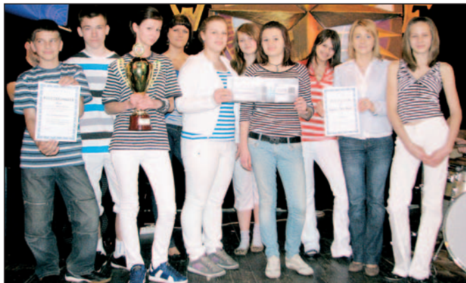
„Ars Nova” z dyplomem tegorocznej „Róży Wiatrów”