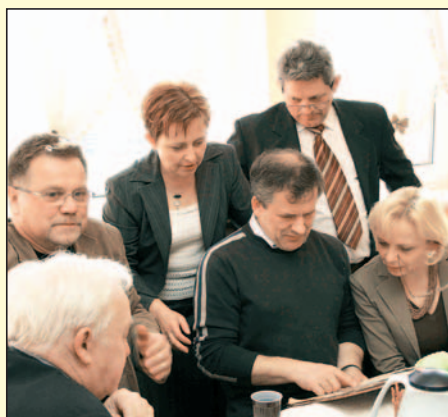
Uczestnicy spotkania oglądają kroniki i wspominają...

W części mniej oficjalnej (w OSP w Lędzinach) każda grupa, która istniała na przestrzeni 35-let działalności, miała okazję coś o sobie opowiedzieć, wspominać