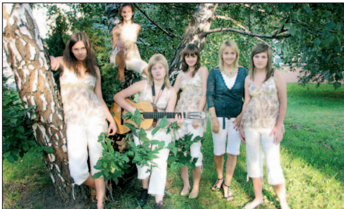
Zespół „Ars Nova” wraz z opiekunką (druga z prawej).

Grupa taneczna „Track” uatrakcyjnia artystyczne przedsięwzięcia szkolne, występuje na wszelkiego rodzaju imprezach na szczeblu miejskim i powiatowym (festyny, Finały Wielkiej Orkiestry Świątecznej Pomocy, imprezy z okazji Dnia Dziecka). Może poszczycić się również wieloma sukcesami. Jednym z nich jest, zdobyte po raz czwarty, pierwsze miejsce w Powiatowym Festiwalu Muzyki i Tańca w Łędzinach. /6/