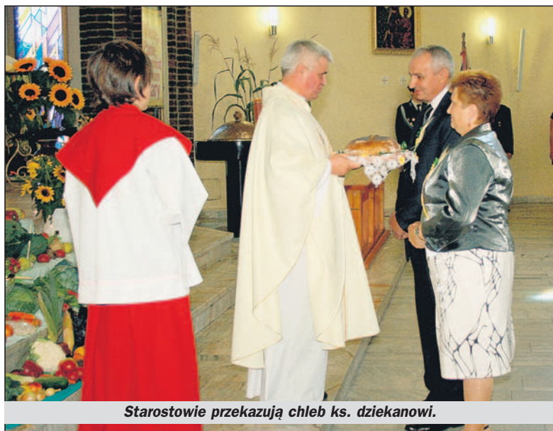
Starostowie przekazują chleb ks. dziekanowi.