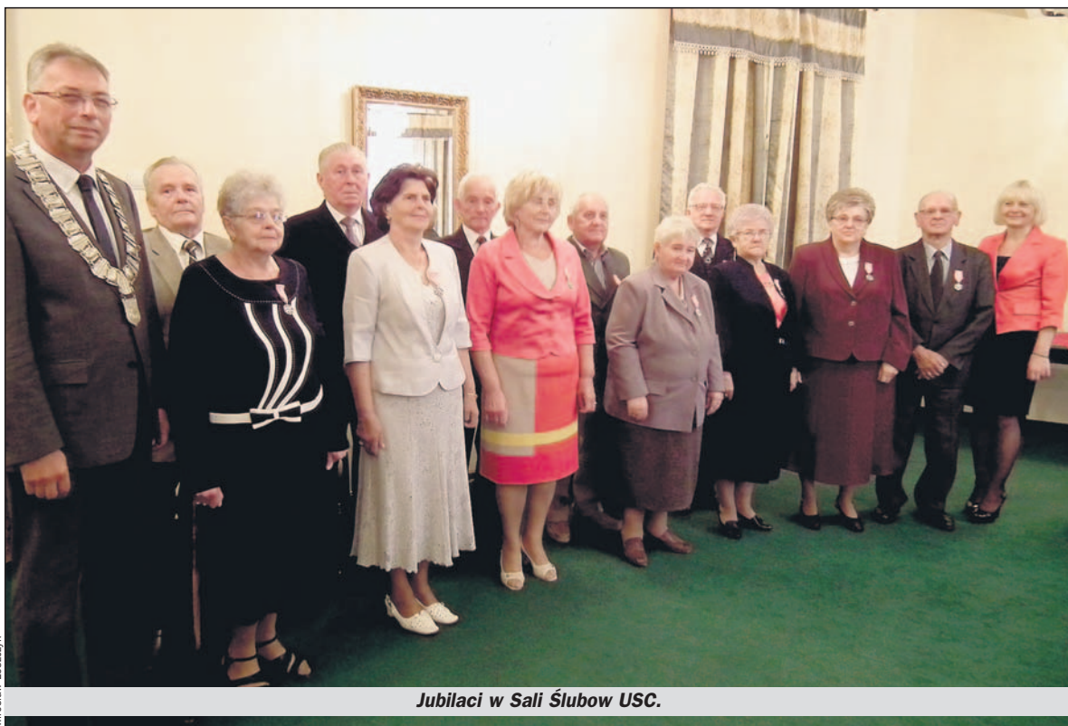
Jubilaci w Sali Ślubów USC.

Dalsza część uroczystości miała już charakter spotkania biesiadnego przy kawie, herbacie i kołoczku. Bardzo szybko Jubilaci znaleźli wspólny język nie tylko ze sobą, ale także ze swoimi gospodarzami, tym bardziej, iż kierownik Ścierańska od razu wcieliła się w rolę moderatora rozmów i dyskusji. Zauważyła, że Jubilaci w zdecydowanej większości są emerytowanymi pracownikami KWK