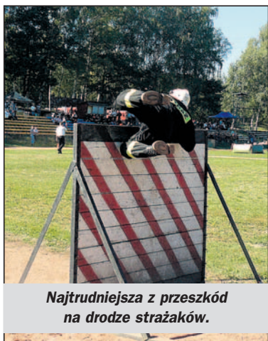
Najtrudniejsza z przeszkód na drodze strażaków.