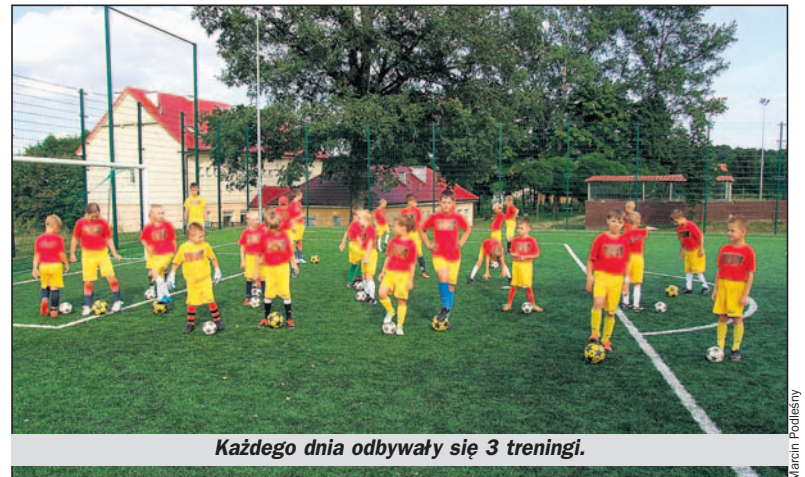
Każdego dnia odbywały się 3 treningi.