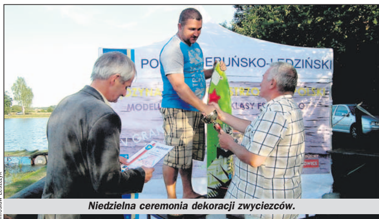
Niedzielną ceremonią dekoracji zwycięzców.