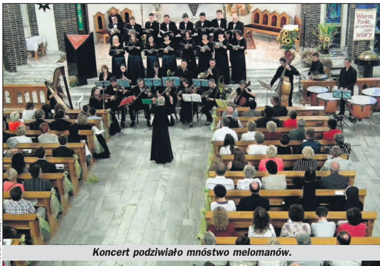
Koncert podziwiali mnóstwo melomanów.

Zespołowi „Pro Arte et Musica” towarzyszyła stworzona specjalnie do tego