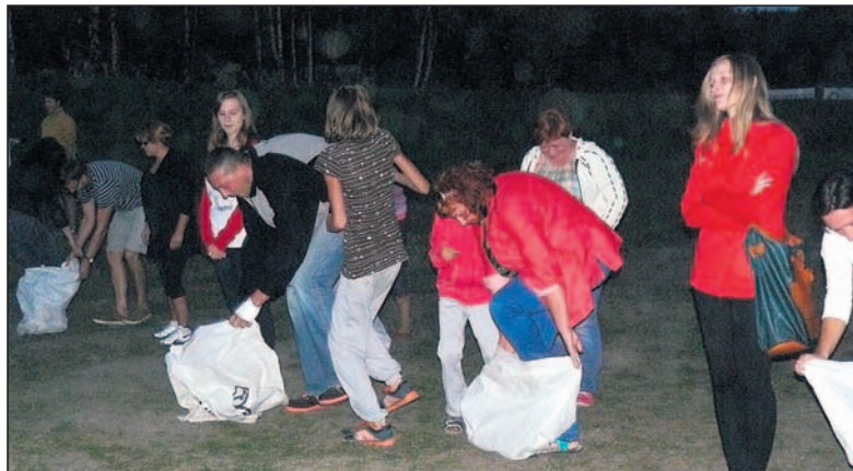
Wyścig w workach rozegrano o zmierzchu.

► Liczne grono mieszkańców zgromadził zorganizowany po raz dziewiąty, tym razem na boisku przy ulicy Murckowskiej, w dniu 7 września przez Miejski Ośrodek Kultury oraz mieszkańców Świnów i Ratusza piknik rodzinny.