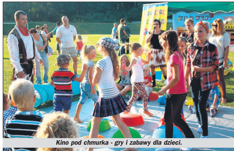
Kino pod chmurka - gry i zabawy dla dzieci.