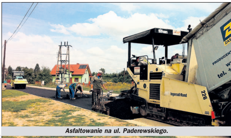
Asfaltowanie na ul. Paderewskiego.

Tymczasem projekt uporządkowania gospodarki ściekowej zakłada odtworzenie dróg po budowie kanalizacji, a nie ich modernizację. Dlatego tam, gdzie odwodnienie nie było, nie mogą one powstać w ramach kontraktów realizowanych przez Buskopol, konsorcja Machnik – Neptun oraz Mikotech – Hydrobudwę. Jediną możliwością, by zainstalować systemy odprowa-