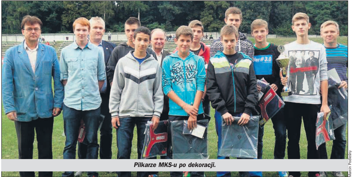
Pilkarze MKS-u po dekoracji.

We wtorek, tj. 27 sierpnia, w przerwie pucharowego spotkania piłkarskiego między MKS-em Łędziny, a III-ligowym Nadwiślanem Góra, trampkarze starsi (rocznik 1999 i młodsi) łędzkiego klubu odebrali wyróżnienia za zdobycie w sezonie 2012/2013 tytułu mistrzowskiego w Podokręgu Tychy.